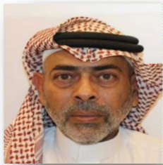
أ.د. محمد نبيه باعشن أستاذ التكنولوجيا الحيوية البيئية جامعة جدة