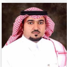
د. سعيد أحمد الزهراني مدير عام الأداء البيئي المركز الوطني للرقابة على الالتزام البيئي