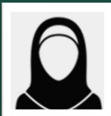
د. ندى غرم الله الغامدي أستاذ القانون البيئي المساعد جامعة جدة