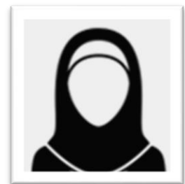
أ.د. عائشة عبده الشاعري أستاذ الرياضيات التطبيقية جامعة جدة